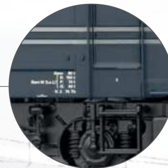
Auf der jeweiligen rechten Lok-Längsseite ist unten an der Aufstiegstür der Halter für die Beheimatung erhaben angegraviert