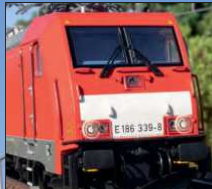
Blinkendes Warnsignal BE/FR/LU