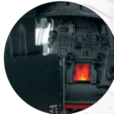
Feuerbüchsenflackern digital schaltbar

Lokomotive zum Jubiläum „100 Jahre Einheits-Dampflokomotive Baureihe 01“