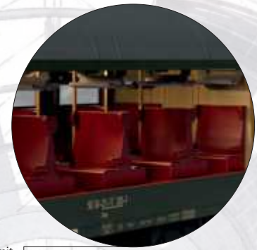
Alle Wagen mit mehrfarbigen Inneneinrichtungen