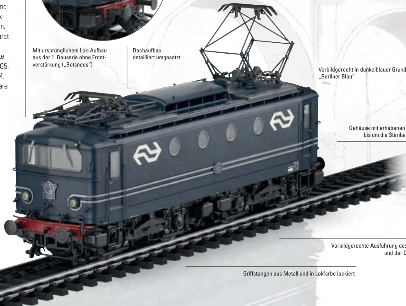
Vorbildgerechte Ausführung des Fahrwerks und der Drehgestelle