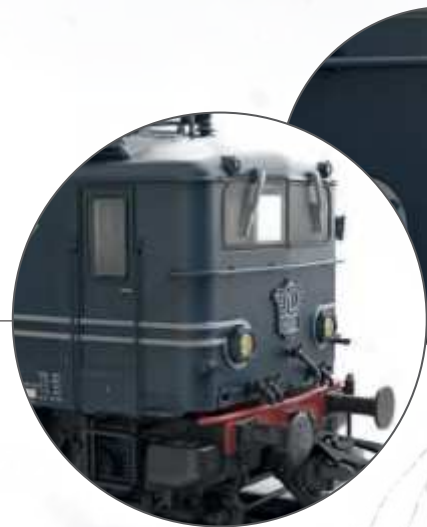
Stirnseitig mit erhabenen dargestelltem Logo und Lok-Nummer

Mit schaltbarer Rangierbeleuchtung 1 x gelb je Seite links unten